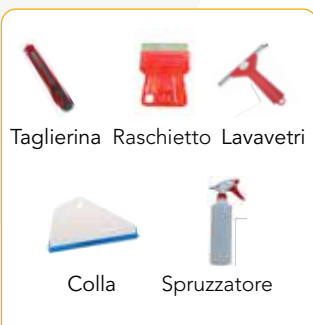
Taglierina Raschietto Lavavetri